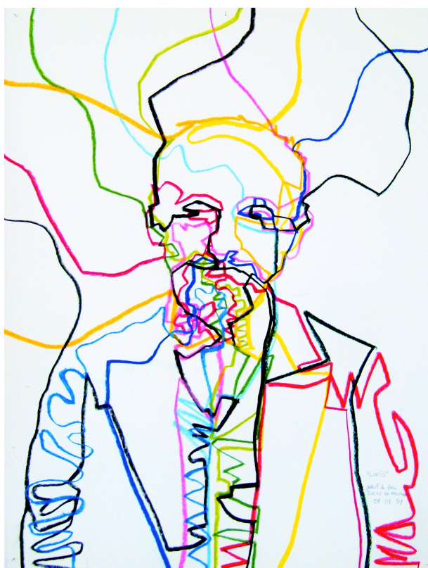
Portrait de Louis Ducos du Hauron par Gérard Fromanger (2009)