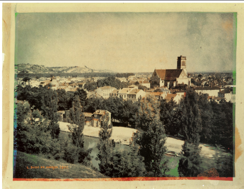
Agen 1877 photographie de Louis Ducos du Hauron

La première photographie couleur, prise à Agen, reposait sur le principe de Maxwell de décomposition de la lumière par les trois couleurs fondamentales que sont le rouge, le vert et le bleu. Il réalisa trois photographies d'un même sujet au travers de filtres de verre colorés successivement en rouge, bleu et vert, qui laissaient passer seulement les radiations de sa couleur, interceptant toutes les autres. En superposant enfin les trois épreuves, il obtint la restitution des couleurs. Le procédé de trichromie était né. Ducos du Hauron ne connut pas la réussite commerciale et l'histoire se répéta avec une autre de ses nombreuses inventions, la chronophotographie, que l'on appellera plus tard le cinématographe, popularisé par les frères Lumière. Il termina sa vie dans des conditions précaires, ne percevant qu'une maigre rente de la société Cinéma Gaumont et une pension du gouvernement. Louis Ducos du Hauron décède à Agen, le 31 août 1920.